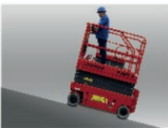
Potente subida en rampa