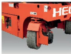
Radio de giro reducido