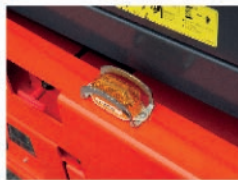
Luces de alarma y advertencia