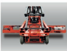
Doble puerta lateral